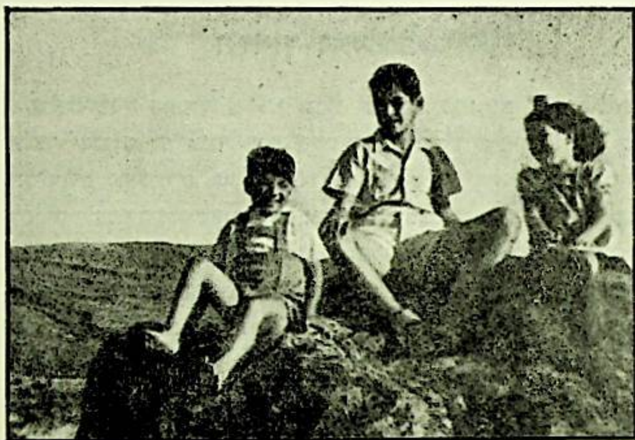
עם בני הדוד