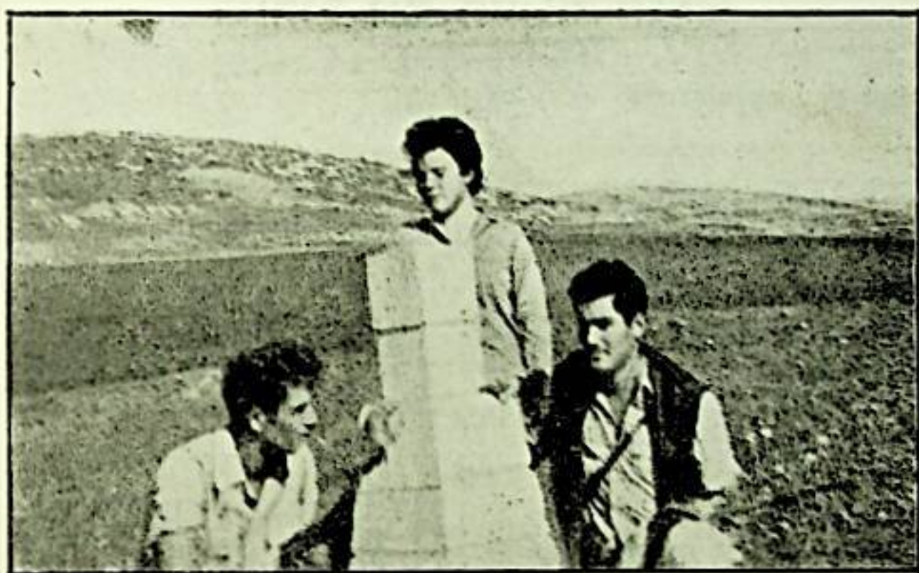
בשדות „אמציה“, ליד אבן-הגבול