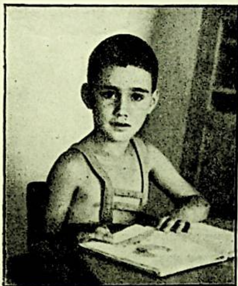
הכרות עם הספר